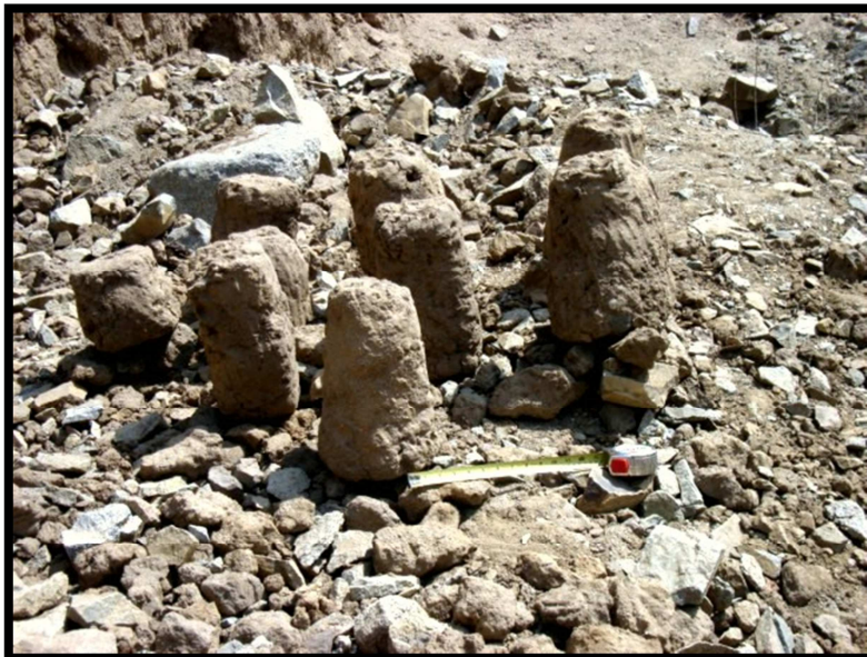
Foto 2. Adobes cónicos y troncocónicos