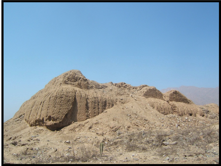
Foto 1. Vista de la esquina noreste del sitio.